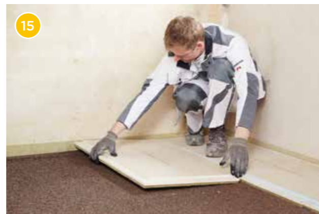
15 Verlegen Sie nun weitere Rigidur EE und verschrauben Sie die Rigidur EE reihenweise im Verlauf. Die Querstöße der Elemente sind um mind. 20 cm zu versetzen.