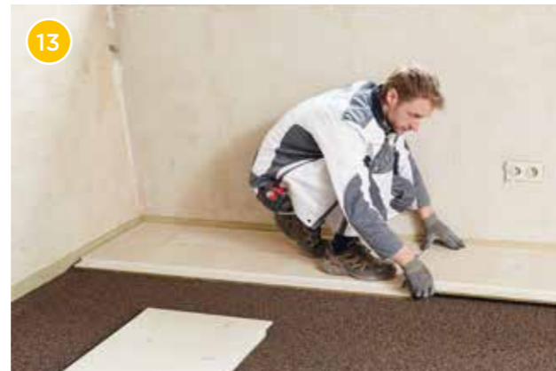
13 Verlegen Sie die Rigidur EE reihenweise im Längsverband.