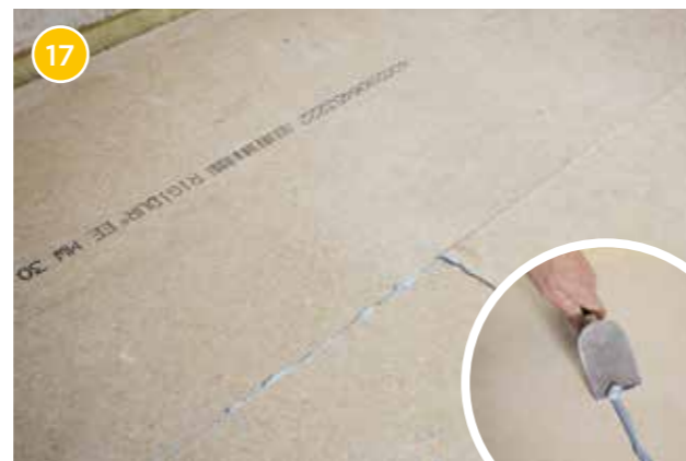
17 Für eine glatte und ebene Oberfläche stoßen Sie überschüssigen Kleber fugenbündig ab. Nach ca. 24 Stunden ist der Kleber komplett ausgehärtet und der Trockenestrich kann mit den gewünschten Bodenbelägen versehen werden.

Jetzt kennen Sie das Geheimnis hinter attraktiven Böden!