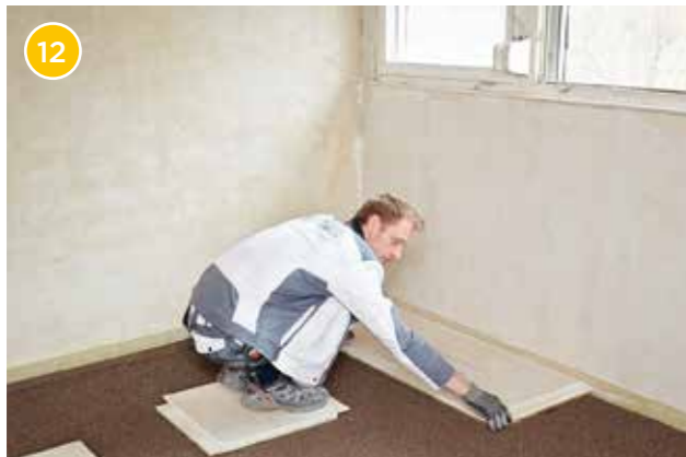
12 Beginnen Sie nun mit der Verlegung der Rigidur EE in der hinteren linken Ecke des Raumes. Legen Sie ggf. Trittschichten aus Rigidur EE aus, um die Trockenschüttung nicht zu betreten.