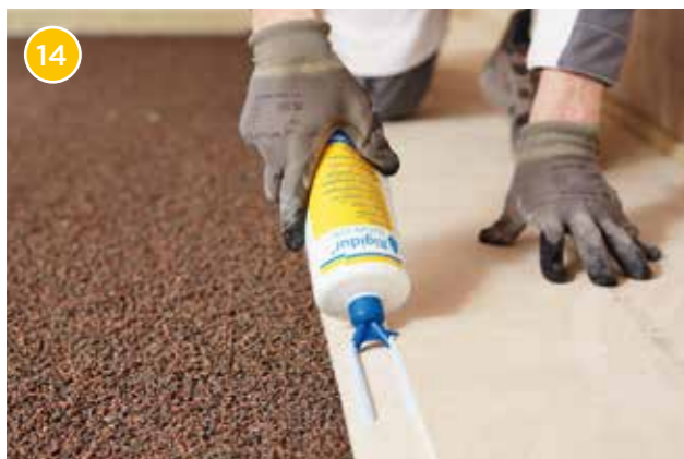
14 Bringen Sie den Rigidur Nature Line Estrichkleber mit der Doppelstrangdüse auf der Plattenkante sowie auf dem Stufenfalz des Rigidur Estrichelements auf.