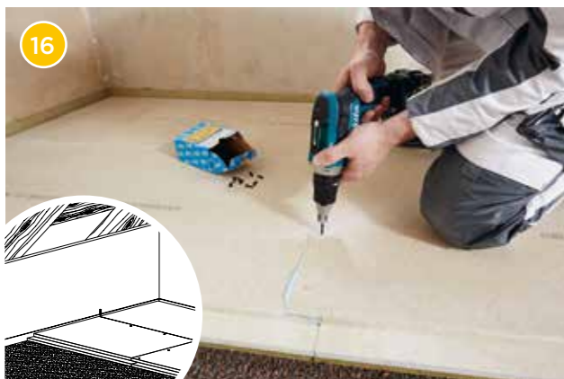
16 Verbinden Sie die Rigidur EE im Bereich des Stufenfalzes mit Rigidur Spezialschrauben im Abstand von ca. 25 cm.